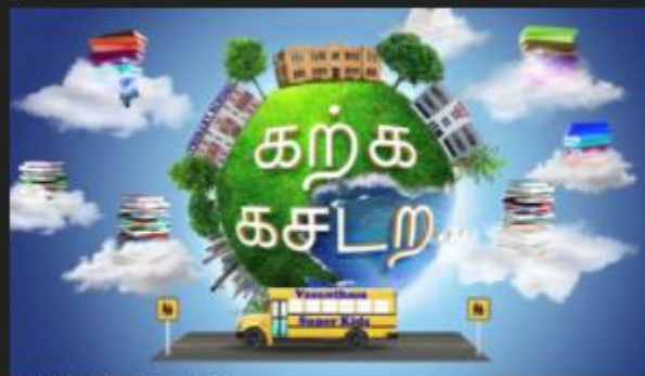
Karika Kasades (Nasrath Super Kids)