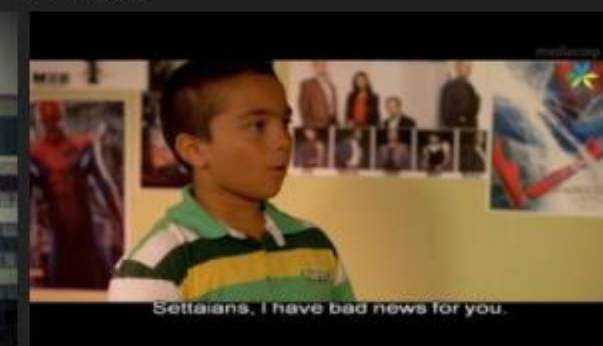
Settai The Series