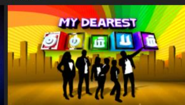
My Dearest Kumbham