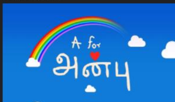
A For Anbu