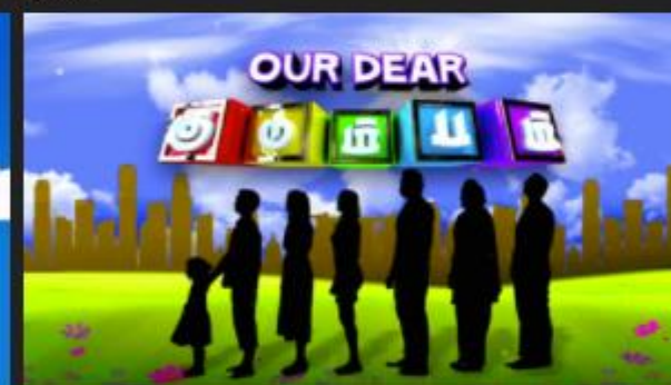
Our Dear Kumbham - Saagaril Spatil 2016