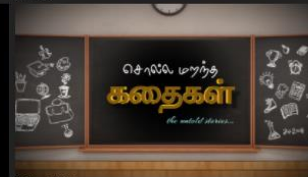
Solla Mantha Kathaiyal